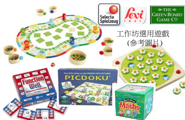
工作坊選用遊戲 (參考圖片)

「遊戲」的好處多不勝數，當中包括啟發思維、提升創意、舒緩壓力、訓練反應力及促進人際關係等，是適合任何年齡人士使用的學習及消閒工具。有見及此，CLASSROOM Playtime! 每次均選用外國進口的優質益智學習遊戲，配合 CLASSROOM Trainers 的理論講解及即場分組遊戲，實踐「從遊戲中學習」的理念。CLASSROOM Playtime! 除能有效培養學生的學習興趣及增進親子關係外，亦能讓老師體會把遊戲引入課堂教學上所帶來的樂趣及效能。